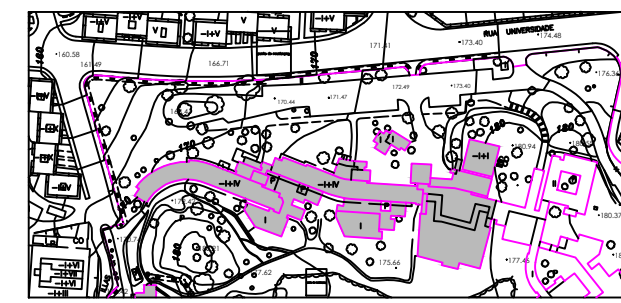
CENTRO RESIDENCIAL DOCENTE